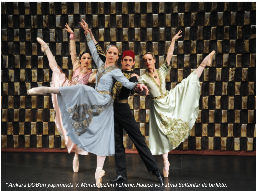
* Ankara DOB'un yapımında V. Murad, kızları Fehime, Hadice ve Fatma Sultanlar ile birlikte.